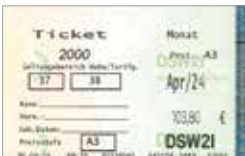
Beispiel der DSW21